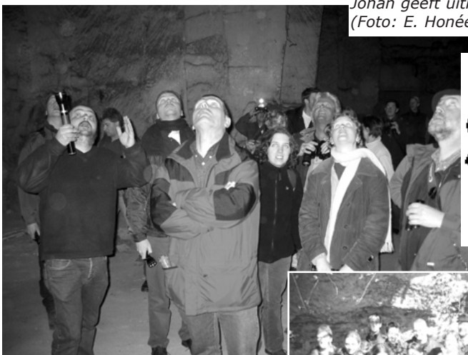
Determinerende factoren, al dwaalde Wil hier eventjes af van het onderwerp