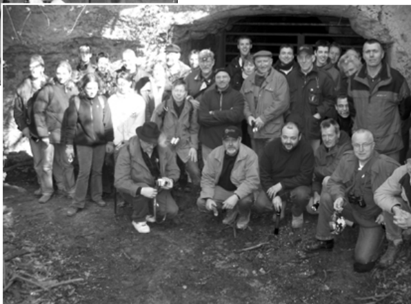
Groepsfoto, 15 maart 2003 Lacroixgroeve, Zichen (B)