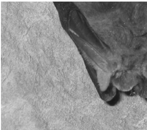
Gewone grootoor; je ziet hier het binnenoor (tragus) vooruitsteken, de "echte" oren zijn onder de vleugels weggeklapt.